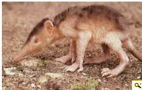
Le solénodon, mammifère venimeux en voie d'extinction.

Concept - Contact - Espace Presse - Flux RSS - Mentions légales · Partenaires - Plan du site - Recrutement - Revue de presse - Recom