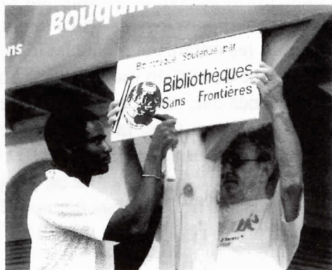
Deux bénévoles de l'association

Bibliothèque Sans Frontière est une O.N.G.* qui accompagne le processus de rescolarisation en mettant en place des bibliothèques de rues et des animations autour du livre dans les camps de déplacés .