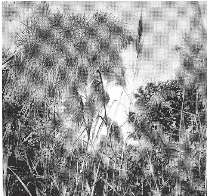
Le panache rose argenté de ton lao est composé d'un grand nombre de petites fleurs.