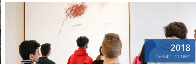
2018 Bassin minier