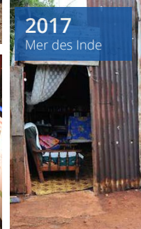
2017 Mer des Indes