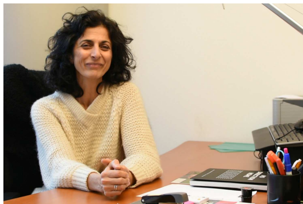
Maria Arena dans son bureau

La rémunération d'un député européen est de 6300€ par mois, cependant ce salaire peut être variable en fonction de sa présence ou si le comportement est jugé irrespectueux et susceptible d'entacher la réputation du parti. Les frais de déplacement dans le cadre du travail sont pris en charge.