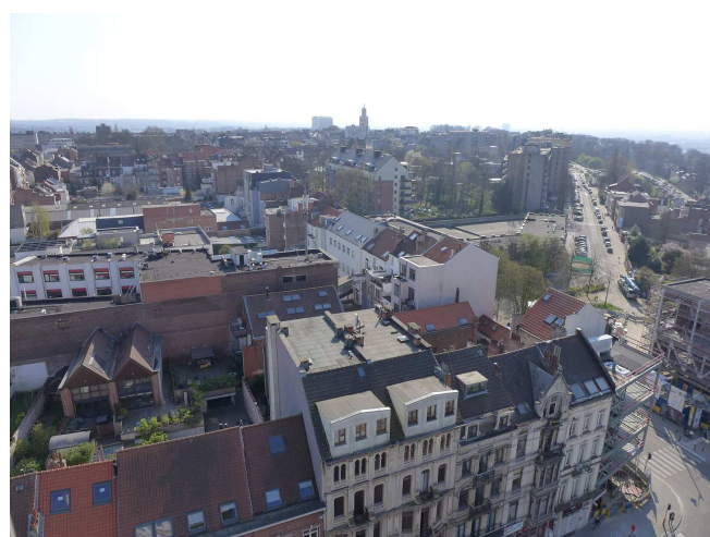
Vue de Bruxelles

Les images dont la source n'est pas précisée sont issues du site : http://www.globe-reporters.org/campagnes-en-cours/bruxelles-coeur-europeen/