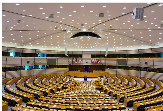
Vues intérieures et extérieures du Parlement