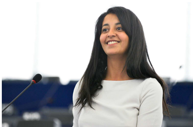
Karima Delli prenant la parole

Tandis que les élections européennes se préparent, Karima Delli, candidate sur la liste Europe écologie, a accepté de répondre à quelques questions sur sa vie d'eurodéputée, l'écologie et son ressenti quant à l'Europe. Elles évoquent son parcours, ses projets et ce qu'elle attend de l'Union Européenne pour les années à venir, notamment en matière d'écologie.