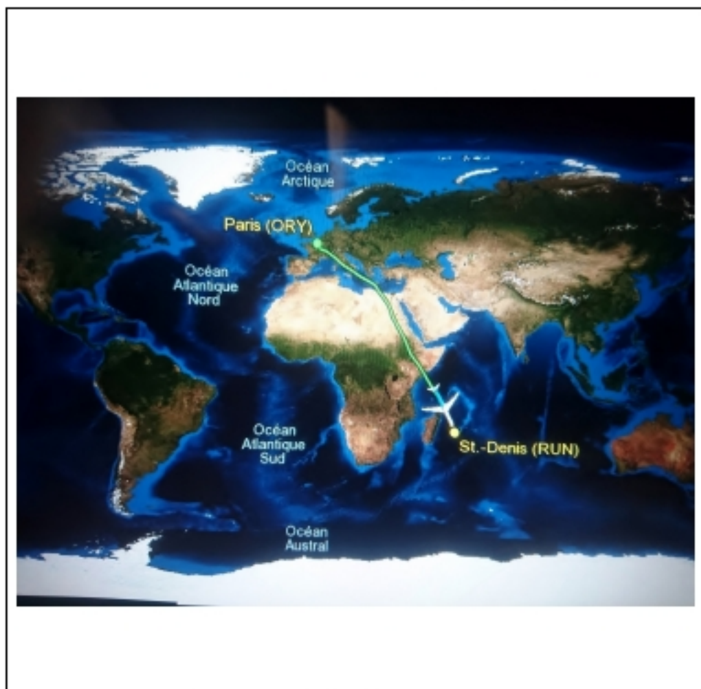
Départ de Paris à destination d l'île de la réunion

culture, vie quotidienne et environnement