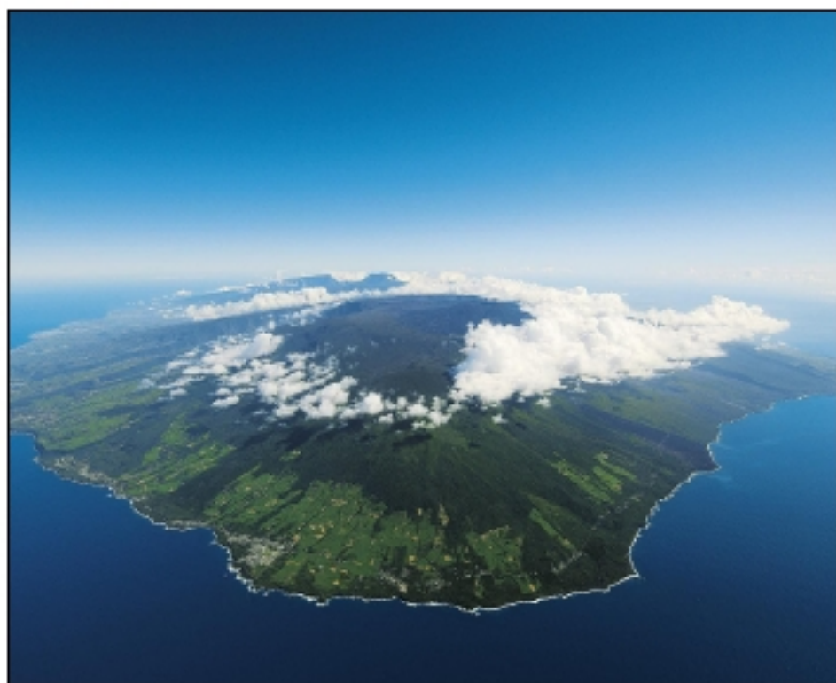
la réunion vue du ciel

Autre : L'île de la Réunion est un département français de l'Océan Indien. Elle est réputée pour son intérieur volcanique et sa forêt .