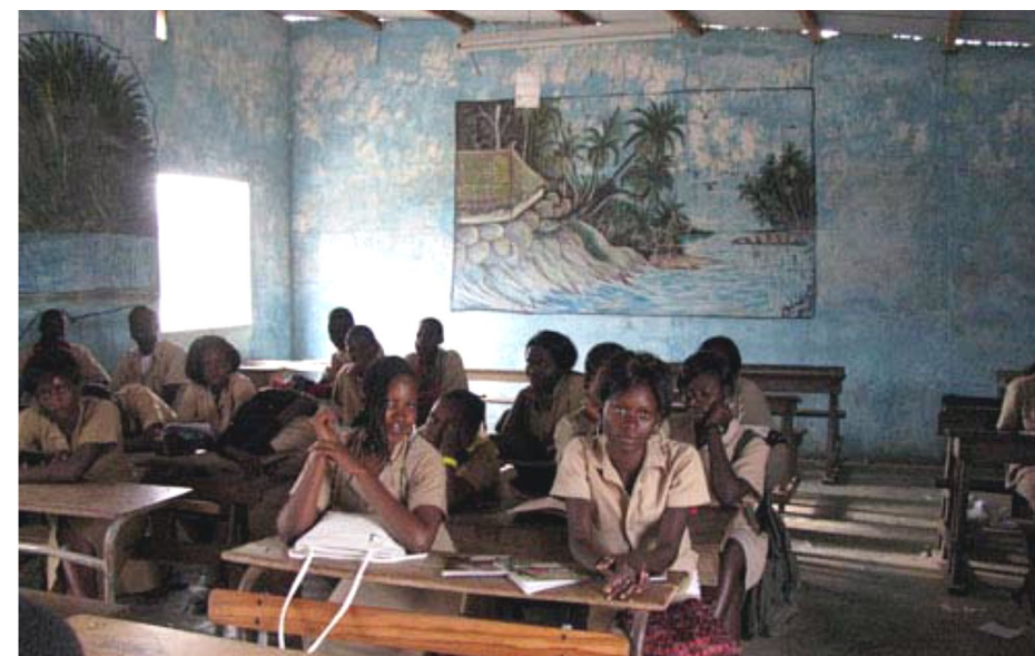
La classe du CEM de Cabrousse

« Quelle motivation et quelle envie de venir au collège ! »