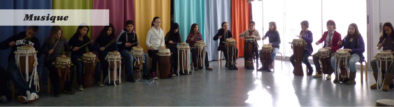
Les 6 e C joueurs de sabar