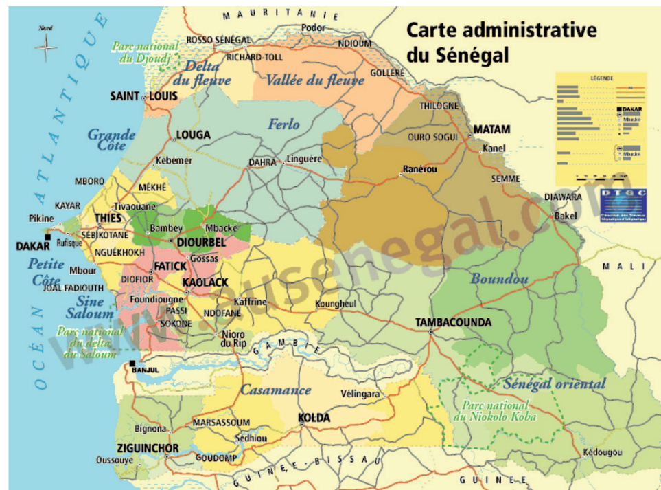
Carte du Sénégal http://www.aus-senegal.com/Cartes-du-Senegal.html

http://www.kassoumai.org , http://atelier.rfi.fr/profile/AlainDevalpo864