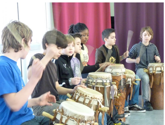
les élèves de la classe de 6 e C, joueurs de sabar.