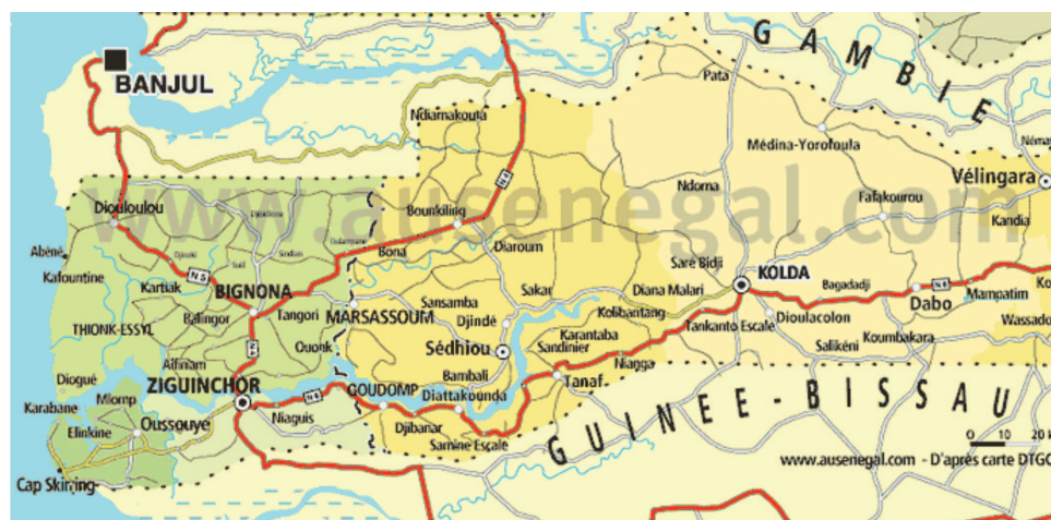
Carte de la Casamance http://www.aus-senegal.com/Cartes-du-Senegal.html