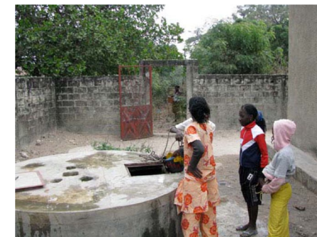
Le puits de l'école